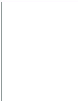
Fotografia del titolare Photograph of the holder (Formato ICAO / ICAO format)

Firma del titolare / Signature of the holder